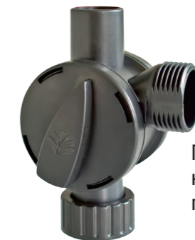
Переключатель направления потока