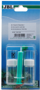
JBL component set for water tests