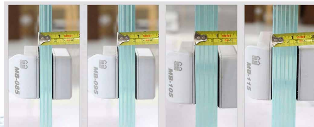
MB-085: 14 mm MB-095: 19 mm MB-105: 24 mm MB-115: 29 mm

Внутренняя часть магнитных скребков серий «MB» и «MB-D» покрыта особой тканью-«липучкой» с «волшебными крючочками», которая легко и без царапин очищает стекло от водорослей, обростаний и слизи