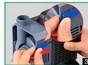
3 Разблокировка фиксатора импеллера