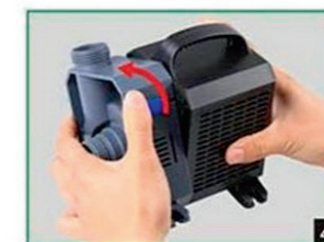
4 Снятие корпуса импеллера