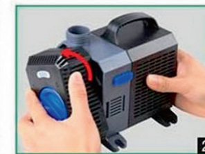
2 Снятие крышки с фильтром