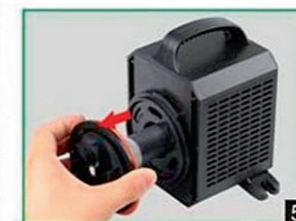
5 Извлечение ротора импеллера