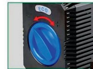
1 Регулировка производительности

Легко разобрать, легко почистить, легко собрать: