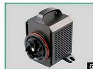
6 Замена герметизирующей прокладки

Диаграммы производительности насосов серии СТР-1000