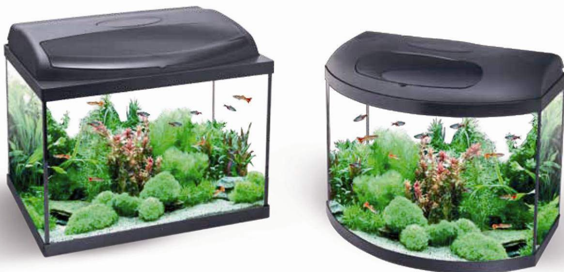
AQUA4HOME с прямым и с фигурным передним стеклом

Также важно подумать не только о том, чтобы аквариум внутри был красивым, но и о том, чтобы он вписывался в интерьер комнаты. Вы можете выбрать в каждой линейке аквариумов AQUA4HOME модели, как с прямым передним стеклом, так и с фигурным. Последний вид аквариумов пользуется популярностью среди людей, склонных к нестандартным решениям в интерьере.