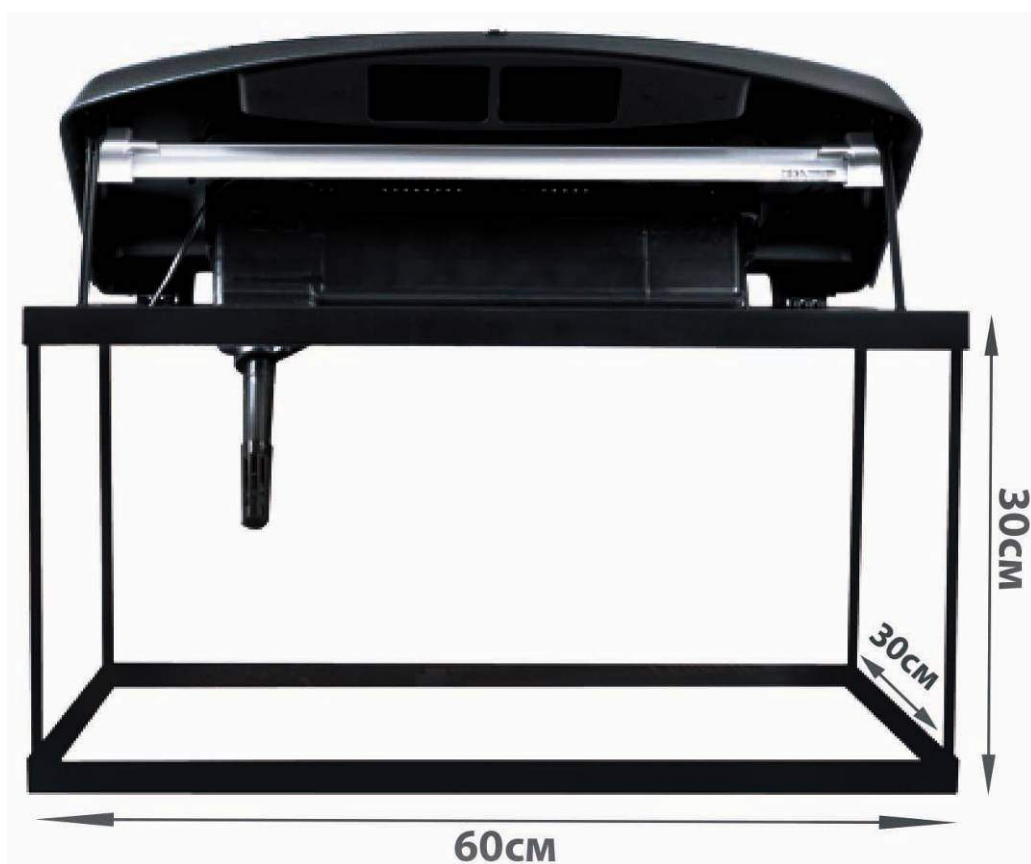
AQUA4HOME 60 - пример идеального соотношения длины, ширины и высоты аквариума

Первое, на что необходимо обращать внимание при выборе аквариума – это его габариты. Классическим, считается аквариум с длиной вдвое превышающей, как его высоту, так и ширину. Такое соотношение размеров не только является наилучшим для декорирования аквариума, но и физиологично для большинства рыб – в таком аквариуме рыбы будут чувствовать себя наиболее комфортно. В качестве примера идеального соотношения длины, ширины и высоты можно привести аквариум AQUA4HOME 60 от Aqual. На схеме вы можете наглядно увидеть, что высота и ширина составляют по 30см, тогда как длина аквариума – 60см.