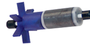
Ротор импеллера с керамической осью