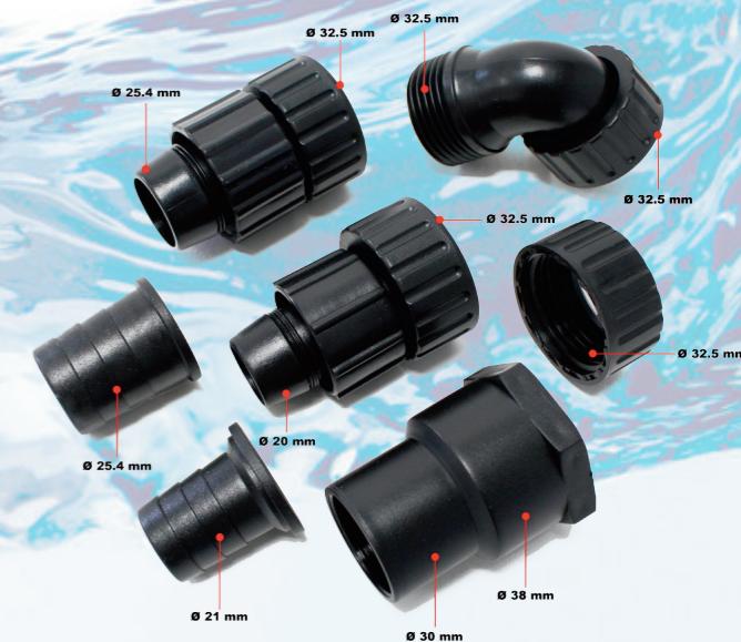
Сменные насадки – прямые и угловые патрубки для шлангов разного диаметра