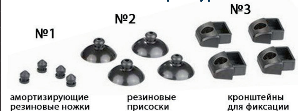
амортизирующие резиновые ножки