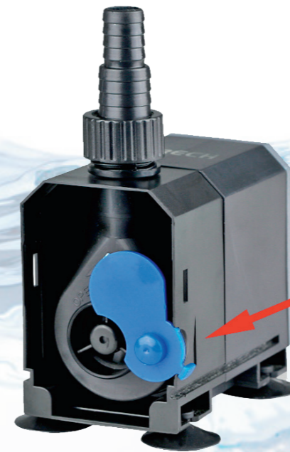
Плавная регулировка производительности