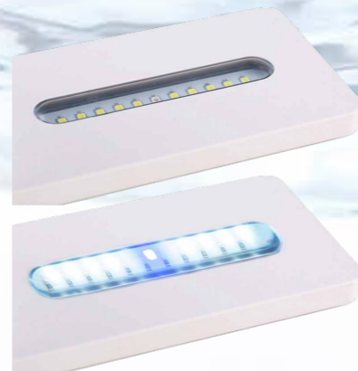
10 белых и 1 синий светодиод