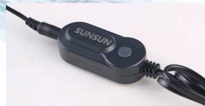
Внешний выключатель питания